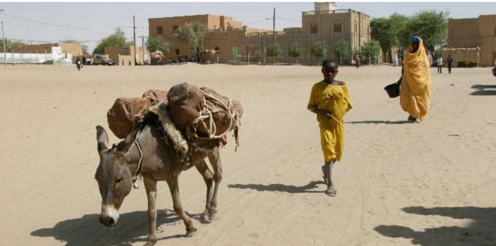
Torget i Timbukto