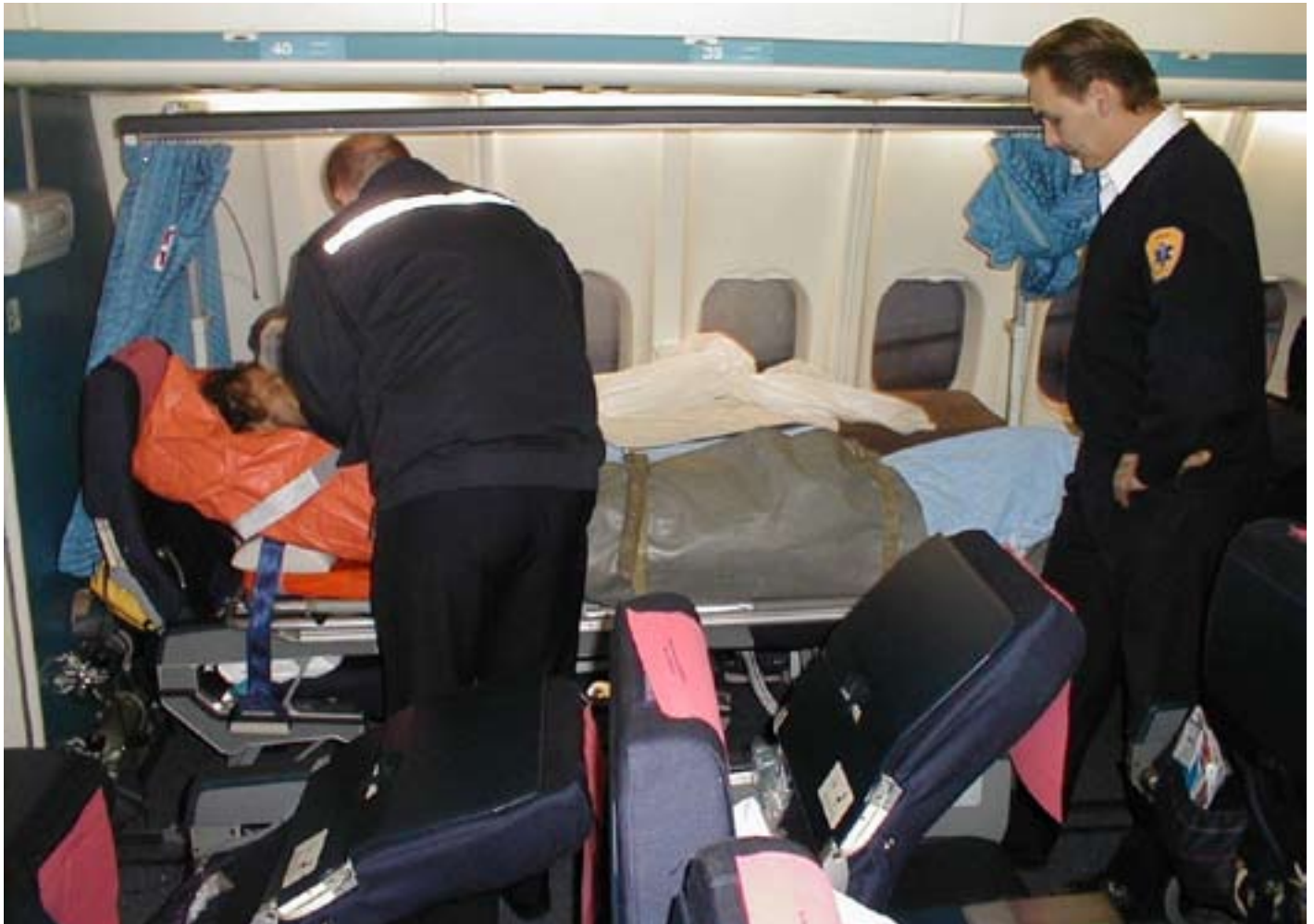
Afhentning i fly.

Det kan desuden nævnes, at administrationen af den offentlige rejsesyge-