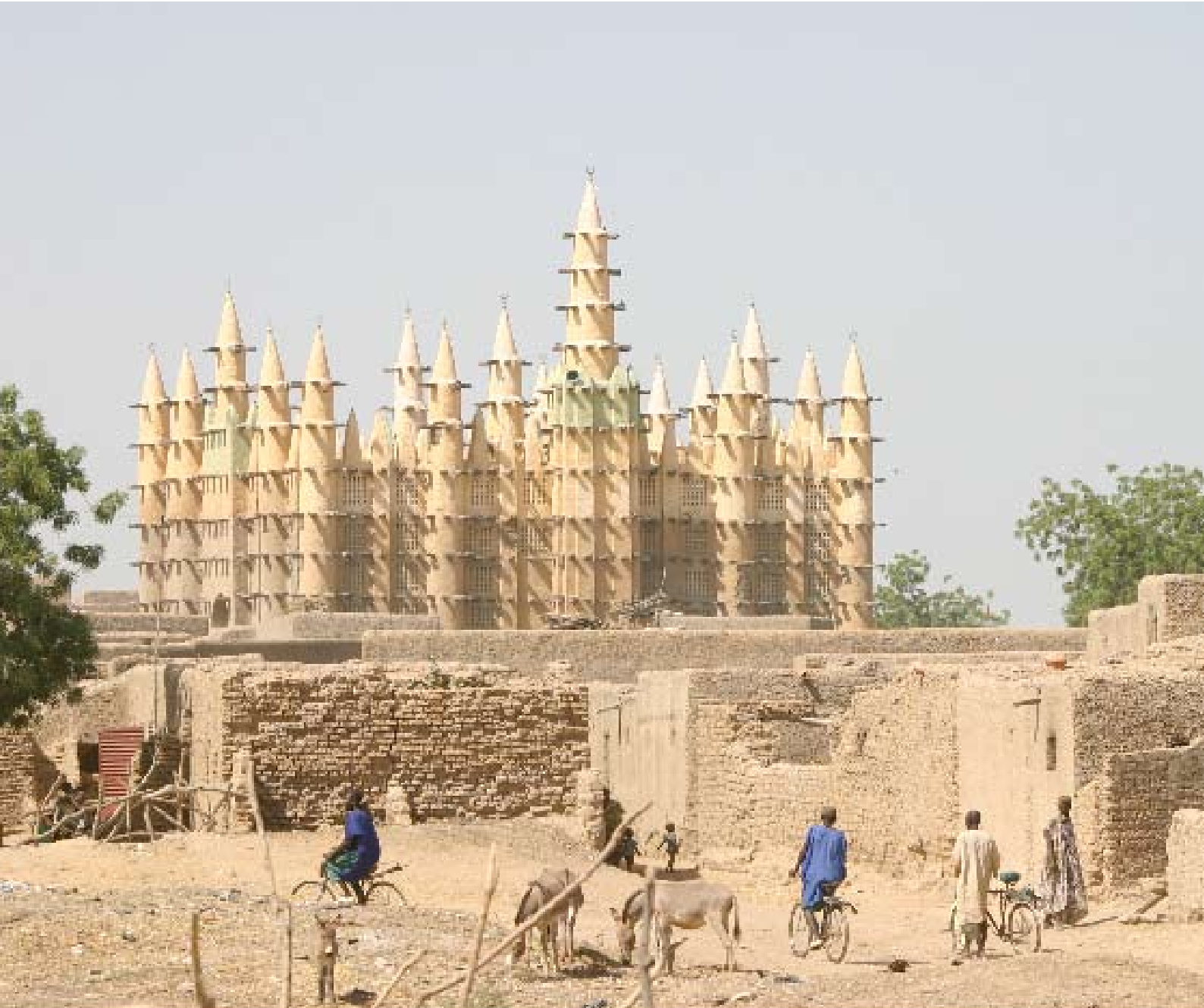
Moske ved Niger