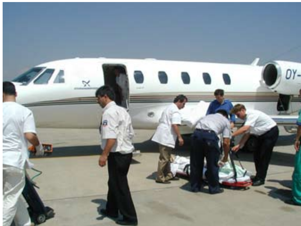
Patient ved flyet.

Et andet kort der også fortjener opmærksomhed er det "blå kort", hvis officielle betegnelse er EHIC (European Health Insurance Card). Dette kort er ▶