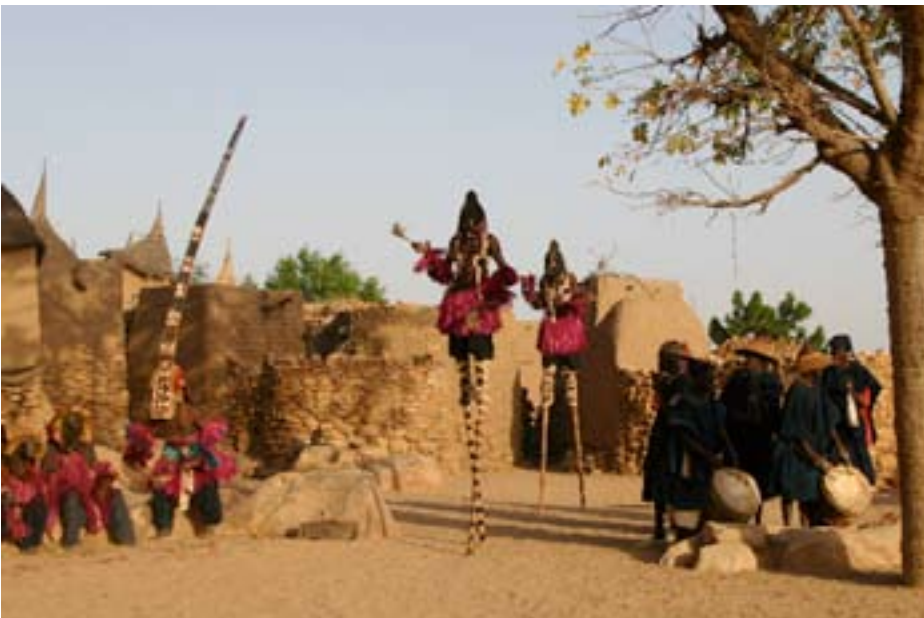
Maskedans i Dogon