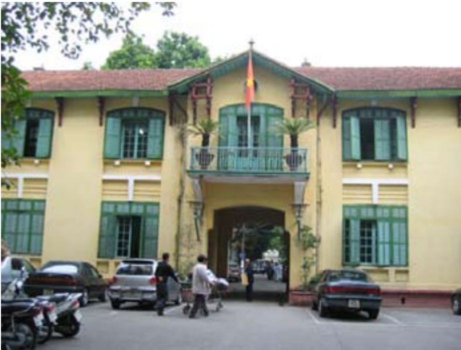
Hospital Hanoi Vietnam.