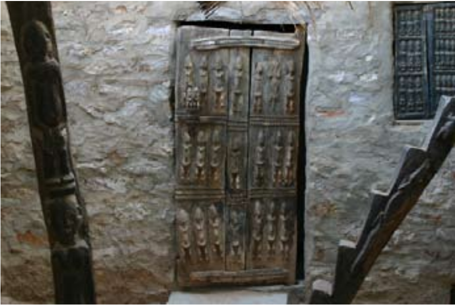
Træskærerarbejde i Dogon