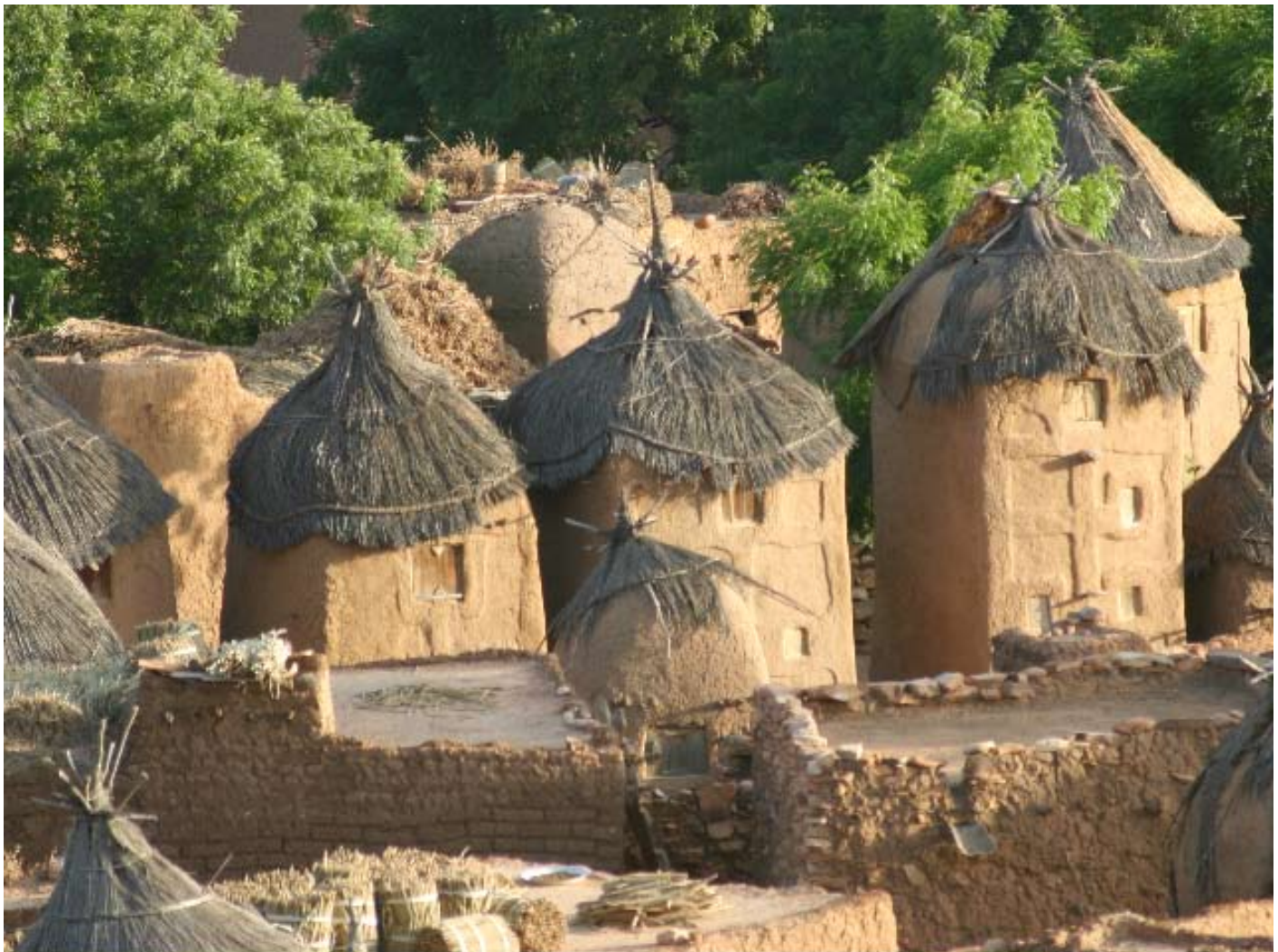
Forrådshuse i Dogon