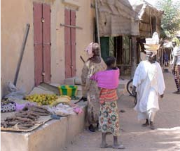
Gadeliv ved Niger