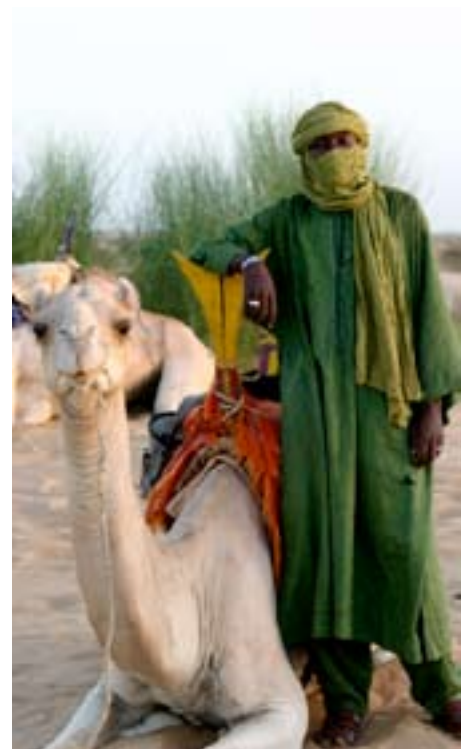
Tuareg med kamel