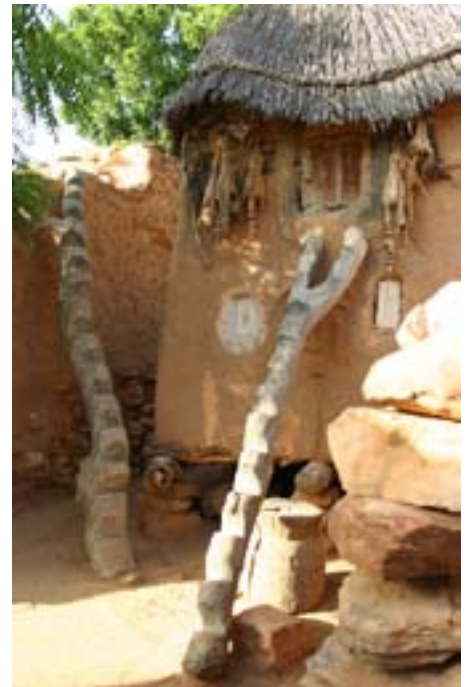
Medicinmandens hus i Dogon

Vi drog videre på en 3 dages vandretur i bjergene – i Dogonland. Her er kulturen helt anderledes med gamle ritualer, medicinmænd og et landsbyråd, der holder møder under et lavt tag – for at man ikke skal fare op i vrede. De gamle vævede tekstiler fremstilles stadig uændret, og forskellige farveteknikker er karakteristisk for de forskellige områder. Træskærerarbejderne er utroligt smukke og findes overalt og de farverige maskedanse afholdes stadig ved særlige lejligheder – og en speciel udgave, når der kommer betalende gæster.